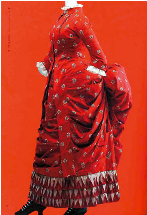
今年8月24日至12月5日於日本森美術館展出的「Fashion in colors」，據了解僅展覽場地的設置費用就要四千萬日幣，是一個具備優渥經費所打造的出的展出，圖為展出作品之一隅。

如果問題的對象是公立美術館館長或展覽組長，這應該是很真心的一種回答。他們可以很篤定的告訴你：「我的館雖然每年都編列了預算，但這些錢一直都是不夠用的！舉個最簡單的例子好了，如果想躋身國際級美術館，我總得從國